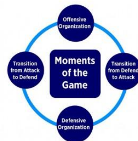
Figure 1. Moments of the soccer game.